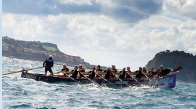
Baleinière en régates appelée ici «traînière».