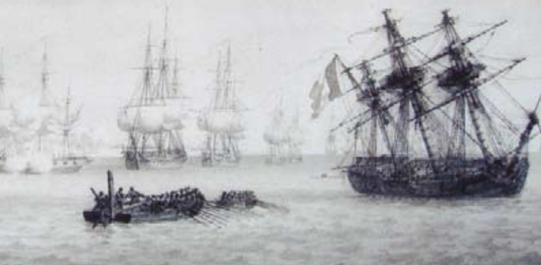
municipal de Fouras

matin ; alors le Regulus restait le seul fortement échoué sur les vases vis-à-vis de Fouras, à l'embouchure de la rivière de Rochefort, n'étant protégé par aucune batterie de la côte, ne pouvant présenter que la poupe à l'ennemi et ne lui opposer que les 6 canons de retraite. Toute cette journée la flottille anglaise qui me serroit de près fit de grandes dispositions pour m'attaquer, les trois brûlots furent mis en mouvement, plusieurs péniches furent disposées à les remorquer. Le flot et les vents d'ouest pouvoient les porter directement chez moi. Ne doutant pas que l'ennemi n'exécuta son projet vers le soir ou dans la nuit, je fis aussi toutes mes dispositions pour le repousser vivement, le combattre jusqu'à la dernière extrémité et enfin, pour assurer le salut de l'équipage dans le cas désespéré où nous eussions