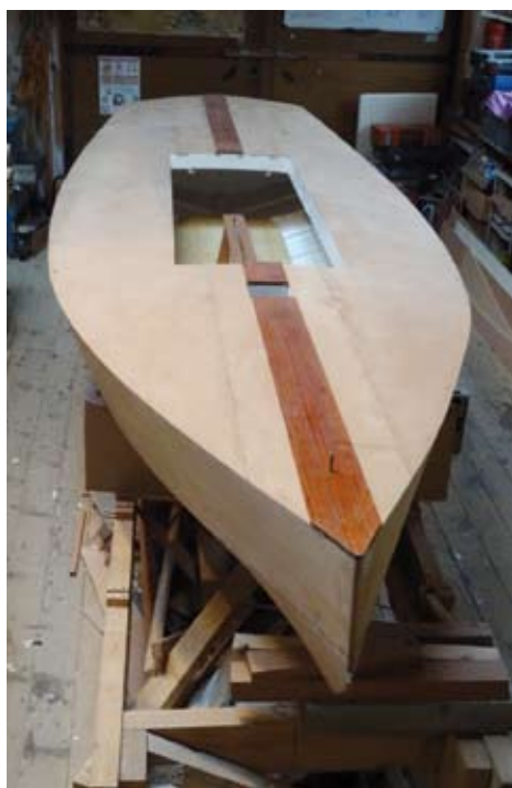
De la belle ouvrage : les dernières photos de la construction du monotype de Nogent