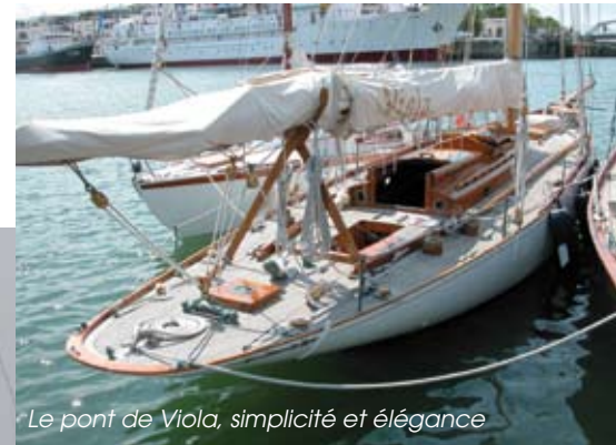
Le pont de Viola, simplicité et élégance