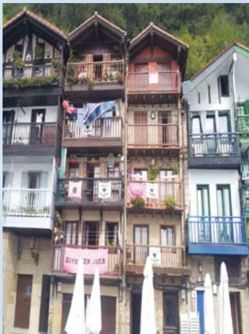
Donibane Kalea, unique rue de Pasai Donibane

Beaucoup d'entre nous sont déjà allés à San Sebastian. Généralement les touristes ne visitent pas le port de commerce : Pasajes. Le guide Michelin ne dit-il pas que «la côte est ici très abîmée par les infrastructures industrielles», ce n'est pas très encourageant ! Pourtant certains Rochelais, anciens marins notamment, connaissent bien ce port pour y avoir livré des ferrailles ou plus souvent... du poisson, ici, plutôt qu'à Chef-de-Baie. Si la pêche décline, Pasajes ou Pasaia en euskara importe toujours de la ferraille pour la sidérurgie basque et exporte les Volkswagen et les Mercedes construites dans la région. Mais tout cela se passe du côté de Pasajes San Pedro.