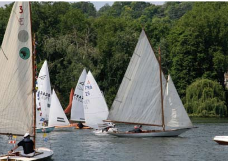
Roastbeef, un 30 m 2 de Gustave Caillebotte reconstruit par l'association Sequana ne fait pas que de la figuration sur une ligne de départ

Parmi les «Z'amis» et particulièrement à la «Petite Plaisance», quelques-uns s'enfoncent à l'intérieur des terres pour découvrir le patrimoine fluvial. En approfondissant leurs recherches, ils découvrent la genèse de la voile légère et apprennent que la Plaisance est née dans Paris intra-muros au début du XIXe siècle. Ces quelques Rochelais curieux ont noué des liens amicaux avec d'autres amoureux du patrimoine nautique, en particulier avec l'association Sequana de Chatou (Yvelines). Certain va même jusqu'à faire partie