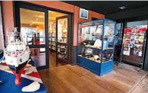
Le carré des Amis