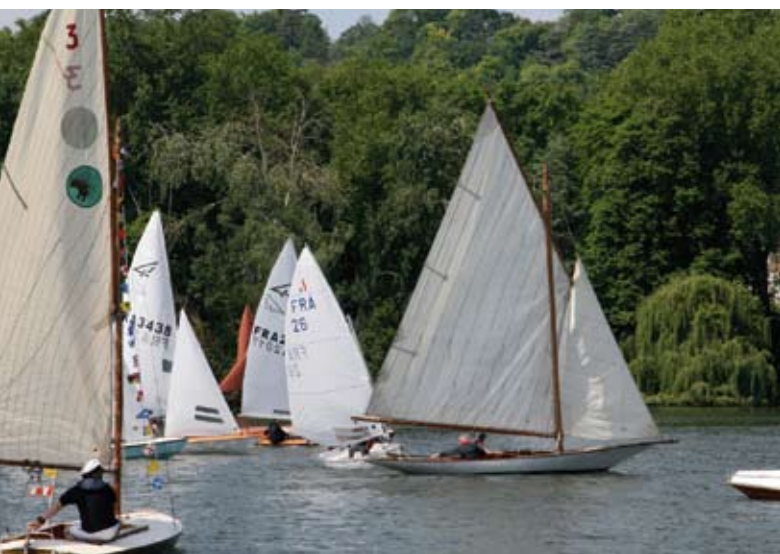
Roastbeef, un 30 m 2 de Gustave Caillebotte reconstruit par l'association Sequana ne fait pas que de la figuration sur une ligne de départ

Parmi les «Z'amis» et particulièrement à la «Petite Plaisance», quelques-uns s'enfoncent à l'intérieur des terres pour découvrir le patrimoine fluvial. En approfondissant leurs recherches, ils découvrent la genèse de la voile légère et apprennent que la Plaisance est née dans Paris intra-muros au début du XIXe siècle. Ces quelques Rochelais curieux ont noué des liens amicaux avec d'autres amoureux du patrimoine nautique, en particulier avec l'association Sequana de Chatou (Yvelines). Certain va même jusqu'à faire partie